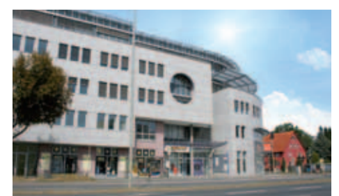
Standort Nürnberg, Nordring 69